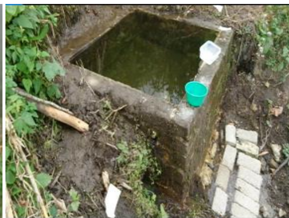
Casa 28. Pileta donde los niños se bañan, a la intemperie

336. En similares condiciones se encontró la Casa 1, donde de acuerdo con la jefa respectiva, el agua “ escasea mucho en esa temporada del año que es de sequía de diciembre a marzo (...) Que sólo hay un ojo de agua, que distribuye a 10 comunidades y se encuentra a 13 kilómetros de la [Casa] ”. Ante esta situación, “ los niños y niñas van a acarrear agua a un pozo que se encuentra a 500 metros de la Casa ” y, por esa misma razón, los niños no pueden bañarse todos los días. Al respecto, en entrevista los niños y niñas beneficiarios enteraron que solo “ se bañan tres veces por semana, con agua caliente cuando hay, pero que cuando no hay, se bañan con agua fría (...) ”.