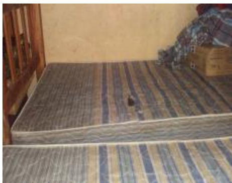
Casa 48. Colchones rotos y deteriorados

muy intenso, por lo que requieren nuevos ventiladores, ya que no todos los que se encuentran instalados en el techo funcionan, lo que se hizo constar en las actas circunstanciadas de las visitas realizadas el 28 de febrero y 1° de marzo de 2017.