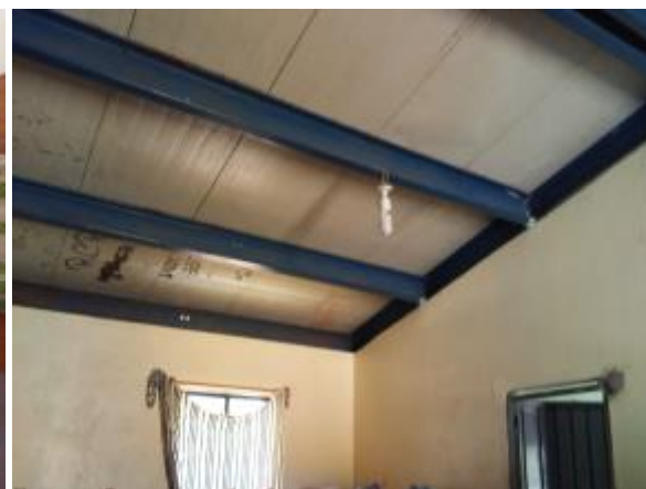
Casa 38. Muro y techo en mal estado.