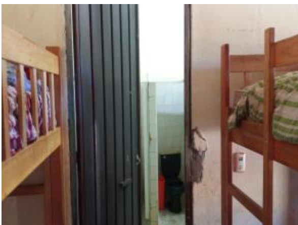
Casa 39. Grietas en los muros.