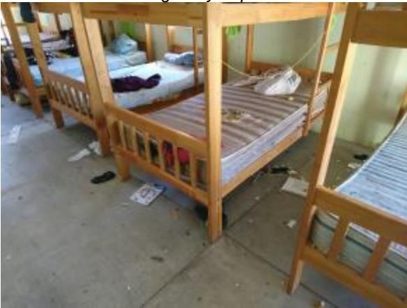
Casa 46. Falta de aseo en instalaciones.