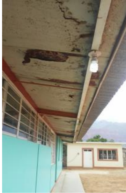
Casa 38. Lámina oxidada en techos.