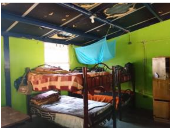
Casa 45.-Techos en mal estado, con picaduras, desgase y filtraciones de agua.

279. Otra Casa que presenta necesidades urgentes de atención. En la entrevista con el Director del CCDI de Silacayoapam, se informó que "se trata de inmueble antiguo, de construcción muy deteriorada" . Ello se constató en las vistas que la Comisión Nacional realizó a esa Casa el 1º y 2 de marzo de 2017, en las que se observaron múltiples deficiencias del inmueble y en el mobiliario, entre las que destacan "espacio es muy reducido, sillas descompuestas, pisos y muros en mal estado" ; "cuarteaduras y filtraciones de agua en los techos, puertas y ventanas rotas (...) cerco perimetral en mal estado (doblado)" . La jefa de esa Casa previno que "el principal problema (...) es que [la Casa] se encuentra en mal estado, que se ha realizado mantenimiento preventivo, pero ya no es suficiente, por lo que es necesaria su reubicación" . Informó que aunque la mayoría sólo acuden a tomar sus alimentos, hay 28 niños que se quedan a pernoctar. Lo anterior se hizo constar en el acta circunstanciada respectiva, a la que se anexaron las fotografías siguientes: