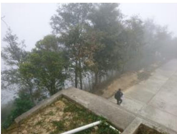
Casa 28. Canchas sin cerco perimetral

que los niños se acerquen o los proteja de una eventual caída. Llama la atención que los límites de las canchas de basquetbol se encuentran cercanas a las pendientes montañosas, lo que representa un grave riesgo para los niños, sobre todo para los más pequeños, pues no hay tipo de señalamiento o protección para evitar se acerquen al sitio, como se muestra en las fotografías siguientes: