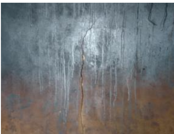
Casa 32. Grieta en muro.