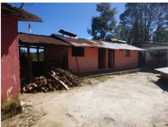
Casa 32. Edificio con techos de lámina oxidada.

en un terreno de suelo con alta plasticidad, por lo que los asentamientos diferenciales y el proceso de oxidación han provocado el deterioro de las construcciones, que implican un peligro latente para los usuarios (...), maximizando este riesgo por la presencia de fenómenos meteorológicos atípicos...". Lo anterior se corrobora con las fotografías obtenidas por personal de la Comisión Nacional: