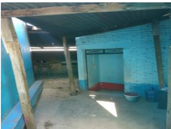
Casa 29. Techos de lámina en mal estado