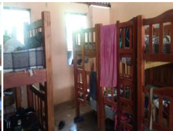
Casa 47: Espacio reducido entre dormitorios.

329. Esta situación ya se ha señalado con anterioridad, en el referido “ Diagnóstico y capacitación en 40 Albergues Indígenas en el Estado de Oaxaca ”, página nueve, que en el que se destacó que los dormitorios en 29 de los 40 centros visitados, presentaban “ hacinamiento y espacios reducidos entre una litera y otra ”, además de que, en el 79% de estos albergues dormían más de un niño por cama.