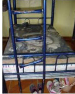
Casa 35. Literas con soportes vencidos.

323. En las tres Casas mencionadas, las puertas de acceso a las diferentes áreas se hallaron en malas condiciones, carcomidas por el óxido que abarca grandes extensiones, por lo que requieren reparación. Además, en la Casa 35 los sanitarios ni las regaderas funcionan, por lo que los niños toman su baño con agua fría “a jicarazos”, a las 5:30 de la mañana.