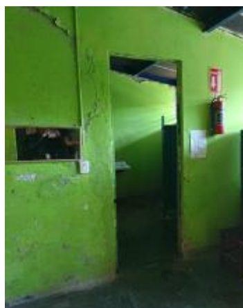
Casa 45. Grietas inclinadas en los muros.

280. SP17, en entrevista con esta Comisión Nacional el 28 de febrero de 2017, indicó que "ya hace muchos años se realizaron las gestiones para la reubicación" , sin embargo, esto no ha sido posible, debido principalmente a que el terreno que se donó para su construcción colinda con la Agencia Municipal de San Antonio las Mesas, en la cual existe un fuerte problema agrario, lo que ha impedido los avances