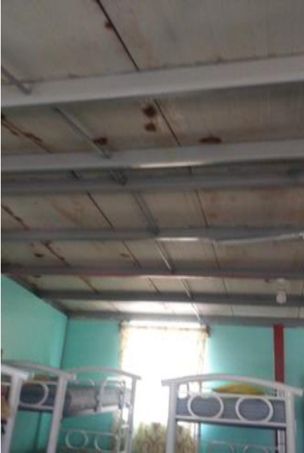
Casa 38. Lámina oxidada en techos de dormitorios.