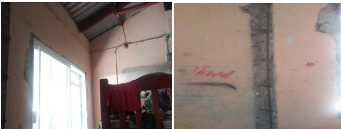
Casa 47. Muros e instalación eléctrica en mal estado. Casa 47. Cuarteaduras en uno de los muros

287. Al rendir su informe, el CCDI de Tuxtepec remitió un Dictamen de la Dirección Municipal de Protección Civil de Tuxtepec, respecto de las condiciones estructurales de las instalaciones de la Casa 47, en el que se concluyó que el inmueble “ presenta fisuras que no garantizan la seguridad estructural ”, detallando, entre otras cosas que “ el terreno sufre de encharcamiento y es una zona de riesgo ”, aunado a que “ cuenta con servicio de energía eléctrica en pésimas condiciones de funcionamiento ”, ya que el cableado y los accesorios se encuentran muy deteriorados, por lo que se recomendó cambiarlos de forma urgente para prevenir algún accidente por corto circuito. Se apuntó que, a esa fecha, los dos extintores con que se contaba habían caducado 73 .