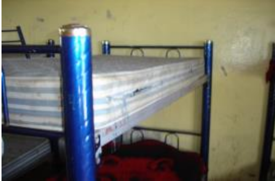
Casa 35. Colchones con roturas laterales.