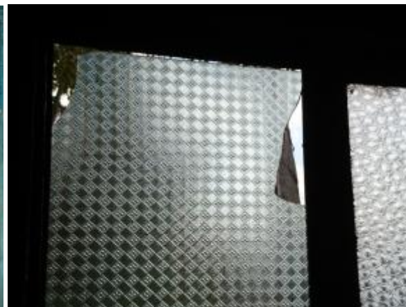
Casa 29. Cristal roto en dormitorio

268. El director del CCDI de Tlacolula precisó que respecto de la Casa 29 se realizó el trámite de reubicación, pero "esto no ha sido posible debido a que no se cuenta con terreno" , ya que el Municipio de Santa María Peñoles no lo ha otorgado. En la información recibida, se advierte que esta Casa "ha sido propuesta en varias ocasiones para su rehabilitación integral, pero por razones presupuestales aún no se ha dado" .