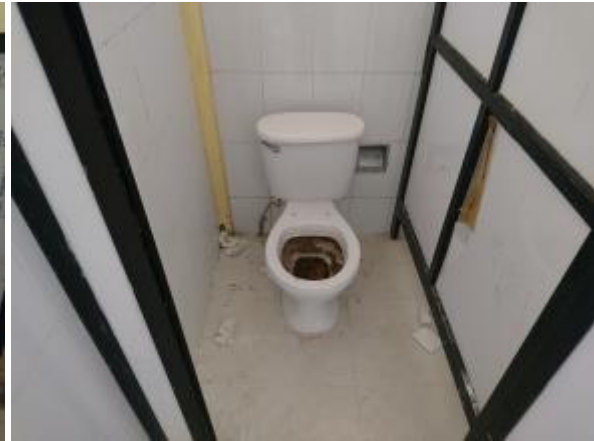
Casa 46. Retretes sucios.