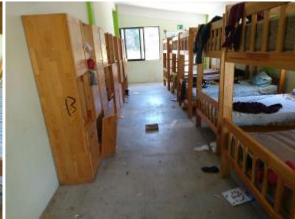
Casa 46. Basura en instalaciones.

340. En el caso del Comedor 1, en la visita del 17 de octubre de 2012, se advirtió falta de higiene en las instalaciones, según consta en la opinión médica de 8 de marzo de 2013. En la visita al Comedor 2, que consta en el acta circunstanciada de 23 de febrero de 2017, se advirtió que se encuentra muy deteriorado, los sanitarios, comedor y cocina no reunían las condiciones de higiene necesarias, además de que se observó fauna nociva, ratones e insectos similares a las cucarachas, los cuales son portadores de enfermedades.