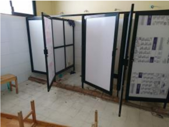
Casa 46. Falta de higiene y limpieza en sanitarios.