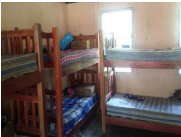
Casa 47: Espacio entre literas.

328. La Casa 39, tiene inscritos 79 niños y niñas, no obstante que el edificio únicamente tiene capacidad para 50 niños, razón por la cual, de acuerdo con lo expuesto por el encargado del CCDI de San Juan Bautista Cuicatlán, se requiere la construcción de nuevas instalaciones. La Casa 47 en la visita del 2 de marzo de 2017, se hizo constar que los espacios destinados para los dormitorios no son suficientes y, por ello, las literas se encuentran muy juntas una con la otra, sin espacio que las separe, como se aprecia en las fotografías que se anexaron al acta circunstanciada respectiva.