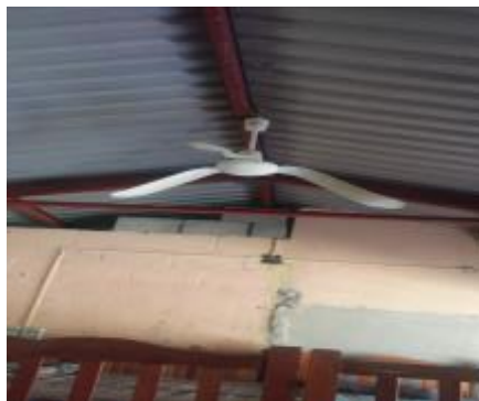
Casa 48. Lámparas que no funcionan.