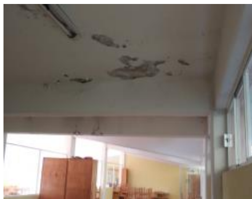
Casa 41. Filtraciones y humedad en muros y techos