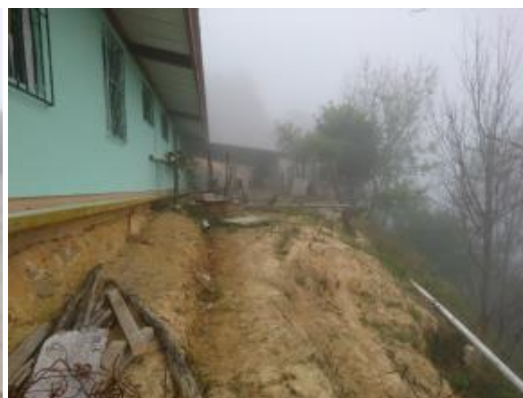
Casa 28. Alrededores sin cerco perimetral

309. Igualmente, en la visita efectuada el 22 de febrero de 2017 a la Casa 34, esta Comisión Nacional constató que “en la parte posterior de la Casa no se observa cerco perimetral, no obstante que el límite es una cañada profunda” . Durante el recorrido realizado, los niños jugaban libremente por las instalaciones, incluida la parte posterior de la Casa, por lo que el riesgo de que ocurra algún accidente es muy alto, lo que se hizo del conocimiento del jefe de la Casa para que tomara las medidas de precaución urgentes, obteniendo como respuesta que solicitaría de inmediato el apoyo urgente de la presidencia municipal de Santiago Lachiguiri. Aunado a ello, tampoco se observaron en esta Casa señalamientos que advirtieran la ubicación de extintores de incendios.