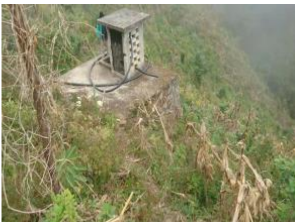
Casa 28. Pendiente inclinada que recorren los niños para acceder a una cisterna de agua.

de accesibilidad que comprenden el derecho al abastecimiento de agua suficiente para uso personal y doméstico. Esta situación sin duda expone a los niños a un mayor riesgo de sufrir accidentes y vulnera su derecho a un nivel de vida adecuado, intrínsecamente relacionado con el derecho al agua, circunstancia que debe remediarse a la brevedad mediante la adopción de medidas idóneas, con la participación de las autoridades municipales, el Comité de Apoyo y la comunidad.