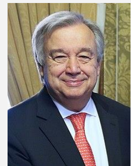
ANTONIO GUTERRES, SECRETARIO GENERAL DE LA ORGANIZACIÓN DE LAS NACIONES UNIDAS.

https://news.un.org/es/story/2019/01/1450132